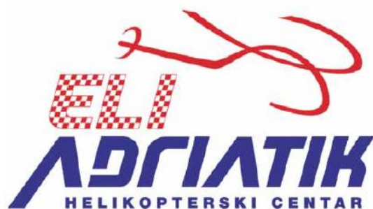
Il logo della società elicotterista

"EliFriulia possiede già un Certificato di Operatore Aereo emesso da EASA valido in tutta Europa, come sarà a breve quello di EliAdriatik. I voli transfrontalieri sono un servizio che già forniamo dall'Italia e non comportano nulla di più dei semplici controlli di polizia che si fanno normalmente negli aeroporti, almeno fino all'ingresso della Croazia nell'area Schengen. Poi non ci si dovrà più preoccupare neanche del controllo passaporti".